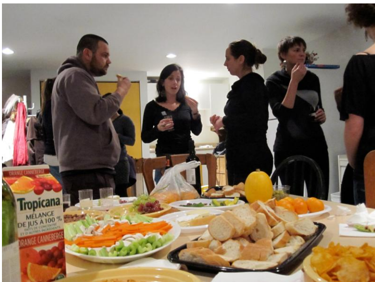
Photo : soirée vins et fromages, 3 décembre 2010